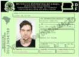
Carteira Nacional de Habilitação (CNH)