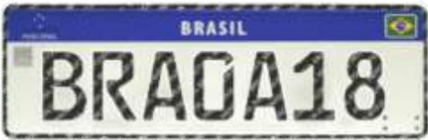
Nova Placa Veicular