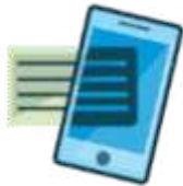
CRLV Digital Certificado de Registro e Licenciamento de Veículo